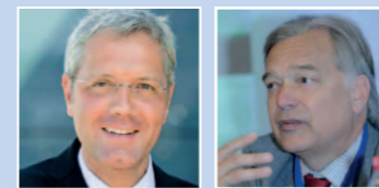
Dr. Norbert Röttgen